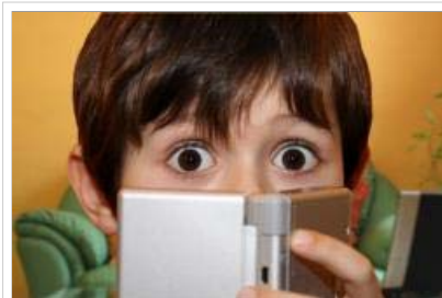
eGames, ob als Onlinegame oder für PC oder Konsolen liegen voll im Trend.